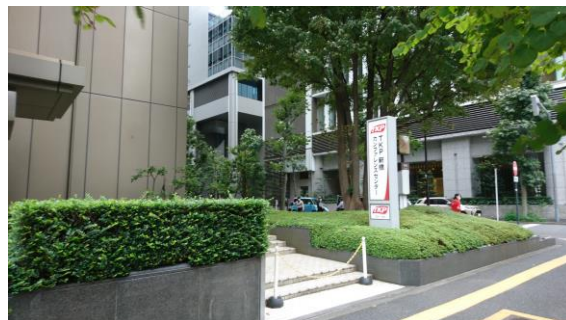
TKP 新橋カンファレンスセンター (千代田区)