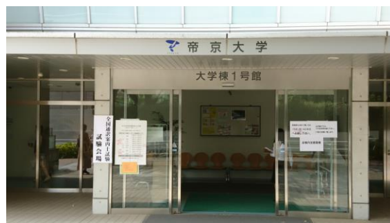
帝京大学 板橋キャンパス（東京第2会場）