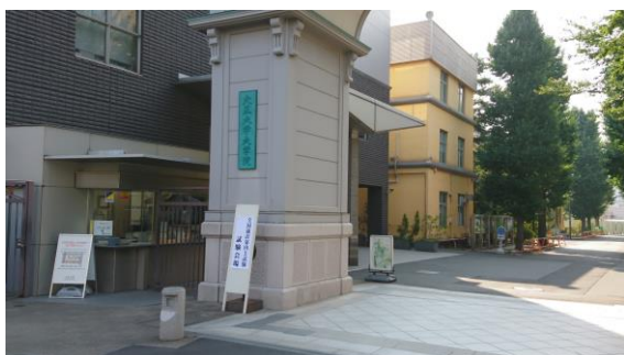
大正大学（東京第1会場）